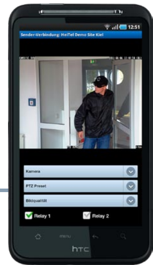
Livebildübertragung mit Kamera- und Relais-Steuerung

Die Pfeile im dargestellten Live-Bildschirm (s.o.) sind nicht zu sehen, sondern markieren den Displaybereich, der mit Hilfe der Fingergesten vergrößert und verkleinert werden kann. Die Relais am HeiTel VideoGateway lassen sich über die Buttons schließen bzw. öffnen.