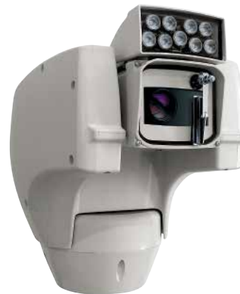
ULISSE COMPACT + LED SCHEINWERFER

Die Bequemlichkeit des direkten Zugangs zu den Schraubklemmen ermöglicht eine Schnellverkabelung des S-N-Kopfes ohne die Verwendung von Anschlussdosen. Für Event-Management steht eine große Anzahl von Alarm-Eingänge n zur Verfügung.