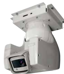
ULISSE COMPACT + UCCMA