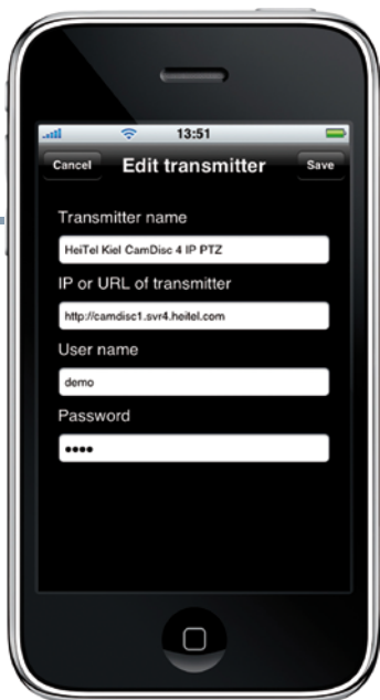
Sender anlegen, ändern oder löschen