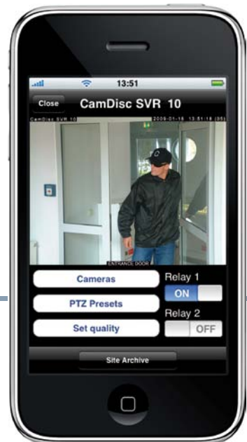
Livebildübertragung mit Kamera- und Relais-Steuerung

Die Pfeile im dargestellten Live-Bildschirm (s.o.) sind nicht zu sehen, sondern markieren den Displaybereich, der mit Hilfe der Fingergesten vergrößert und verkleinert werden kann. Die zwei Relais am HeiTel-Sender lassen sich über die Buttons schließen bzw. öffnen.