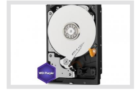
HDD-3000SATA Purple | Artikelnummer: 217657