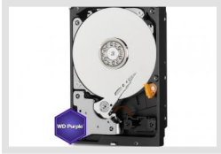
HDD-2000SATA Purple | Artikelnummer: 217658