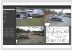
iRAS | Artikelnummer: 206552