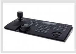
KBD-NSC-100 | Artikelnummer: 74746