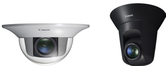
Mit klarem Domgehäuse DR41-C-VB für den Innenbereich

Die VB-H43 Full-HD PTZ IP-Sicherheitskamera vereint überragenden 240fach Zoom mit erstklassigen Low-Light-Eigenschaften und schnellem Autofokus. Sie bietet flexible Installationsmöglichkeiten für den Innen- und Außeneinsatz.