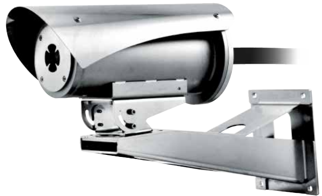
MVXT + NXWBS1