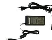
PA-V17 / PA-V18 Netzteil * Wahlweise mit europäischem 2-Stift- oder britischem 3-Stift-Stecker