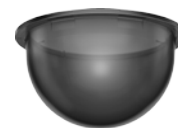
DU640-S-VB Getöntes Dome-Gehäuse