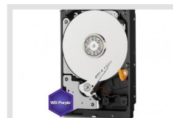
HDD-6000SATA Purple | Artikelnummer: 217660