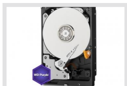
HDD-3000SATA Purple | Artikelnummer: 217657