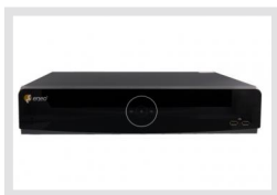
IEM-38R640005A | Artikelnummer: 217651