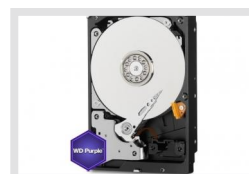
HDD-6000SATA Purple | Artikelnummer: 217660