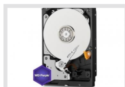
HDD-2000SATA Purple | Artikelnummer: 217658