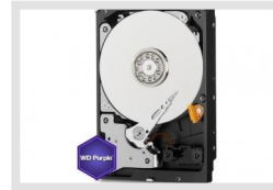
HDD-6000SATA Purple | Artikelnummer: 217660