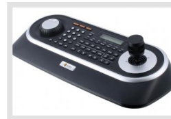
KBD-2U5B | Artikelnummer: 217652