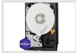
HDD-2000SATA Purple | Artikelnummer: 217658