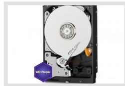
HDD-8000SATA Purple | Artikelnummer: 218583