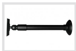
VMC-LCD/WCMB-1 | Artikelnummer: 90394