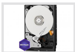
HDD-3000SATA Purple | Artikelnummer: 217657