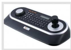
KBD-2USB | Artikelnummer: 217652