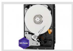
HDD-2000SATA Purple | Artikelnummer: 217658