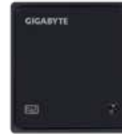
2N® ACCESS COMMANDER BOX