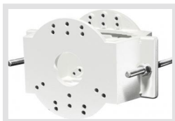
EDC-PM7-W | Artikelnummer: 220492