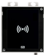
2N® ACCESS UNIT 2.0 RFID 9160334 9160334-S (Sicherung)