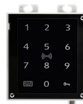
2N® ACCESS UNIT 2.0 TOUCH KEYPAD & RFID 9160336 9160336-S (Sicherung)