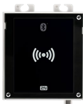
2N® ACCESS UNIT 2.0 BLUETOOTH & RFID 9160335 9160335-S (Sicherung)