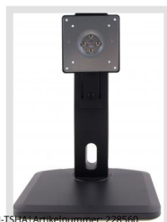
VM-TSHX | Artikelnummer: 228560