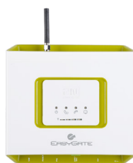
2N® EasyGate PRO

Heutzutage ist die Lösung der Notfallkommunikation ein unabdinglicher Bestandteil eines jeden Aufzuges. Lösung der Notfallkommunikation. Sie gewährleistet eine Verbindung zwischen der Aufzugskabine und wichtige Arbeitsstellen der technischen Unterstützung, womit Sie Ihnen ermöglicht eine fachliche Unterstützung herbeizurufen. Die technologisch ausgereiften Aufzugskommunikatoren von 2N erfüllen zudem die strengen europäischen Normen (EN 81-28, 70) und dank der komfortablen Bedienung sind sie ein wichtiger Helfer bei der Ausführung des regelmäßigen Service oder von Wartungsarbeiten.