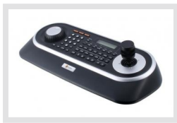
KBD-2USB | Artikelnummer: 217652