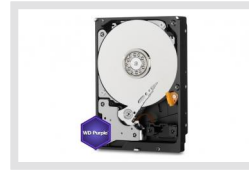
HDD-2000SATA Purple | Artikelnummer: 217658