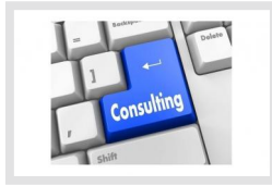
CON-HDD eneo | Artikelnummer: 216959