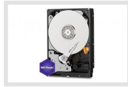
HDD-3000SATA Purple | Artikelnummer: 217657