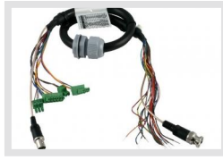
EDC-OPX/IPX-CC1 | Artikelnummer: 74143