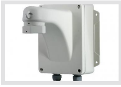
EDC-AKS1 | Artikelnummer: 74125